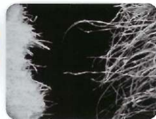
▲パルプ(左)と、当社品：麻(右)の 顕微鏡による拡大図